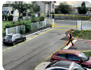
Franchissement de zone