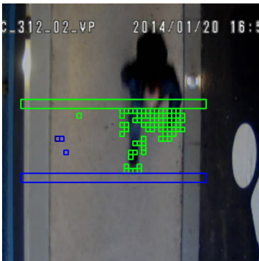
Comptage de personnes

La solution répond parfaitement aux besoins de connaître la fréquentation du nouvel ouvrage et de sécuriser ses accès. Depuis son installation, la solution a donné pleine satisfaction au Grand Lyon, propriétaire du tunnel.