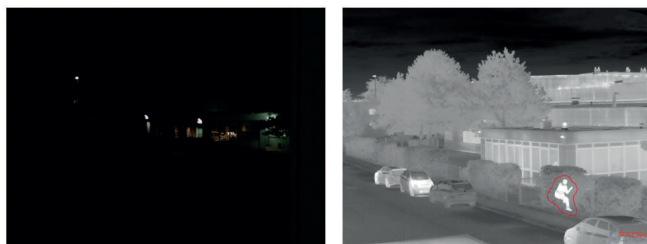
Même scène prise simultanément en caméra couleur et caméra thermique

La levée de doute est efficace par tous les temps, de jour comme de nuit.